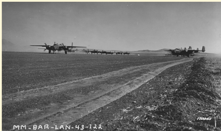
Berteaux Airfield en.wikipedia.org

Commemorazione 82° Anniversario del Bombardamento del 17 Febbraio 1943