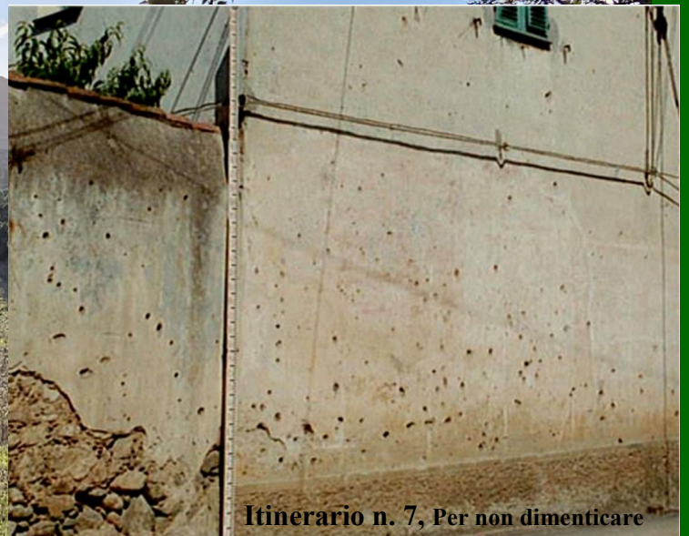
Itinerario n. 7, Per non dimenticare