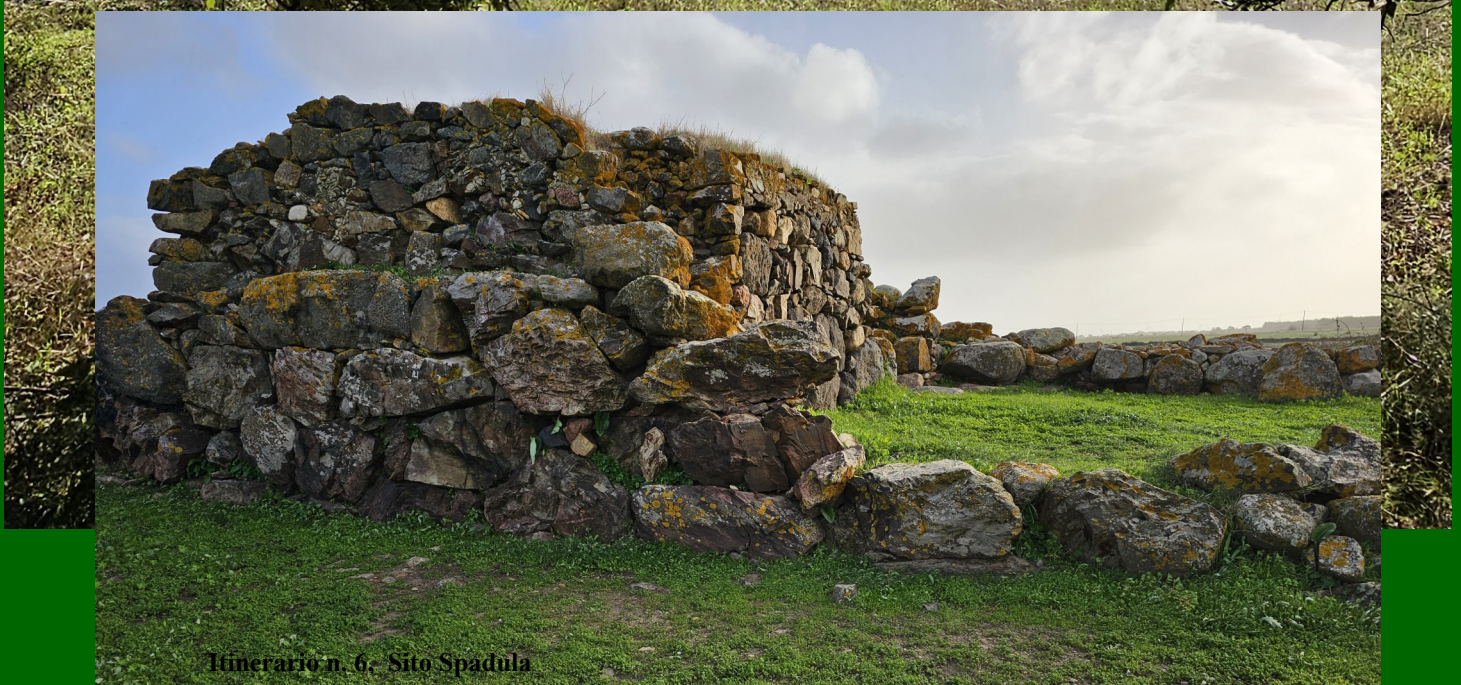
Itinerario n. 6, Sito Spadula