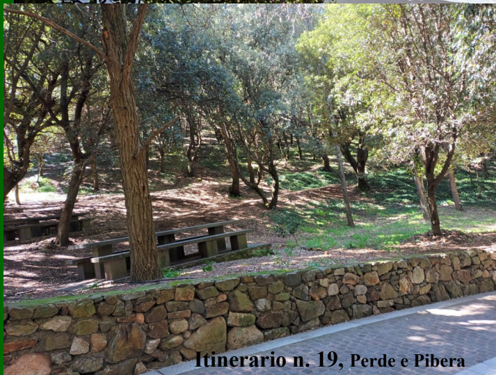
Itinerario n. 19, Perde e Pibera