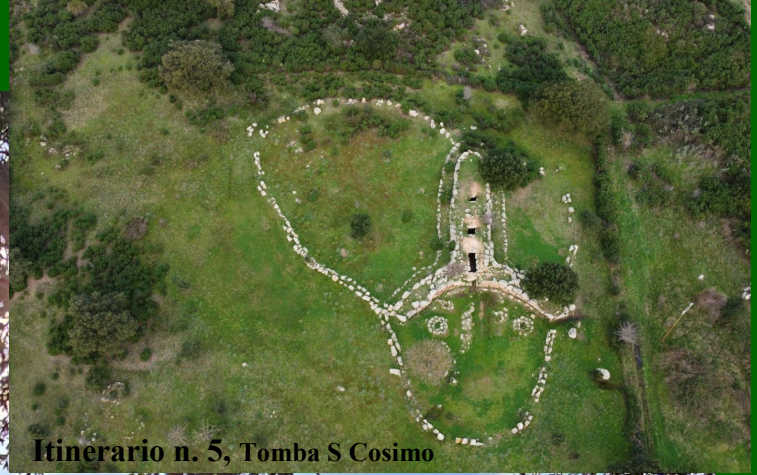
Itinerario n. 5, Tomba S Cosimo