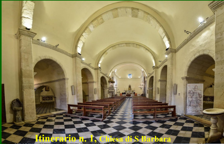
Itinerario n. 1, Chiesa di S Barbara